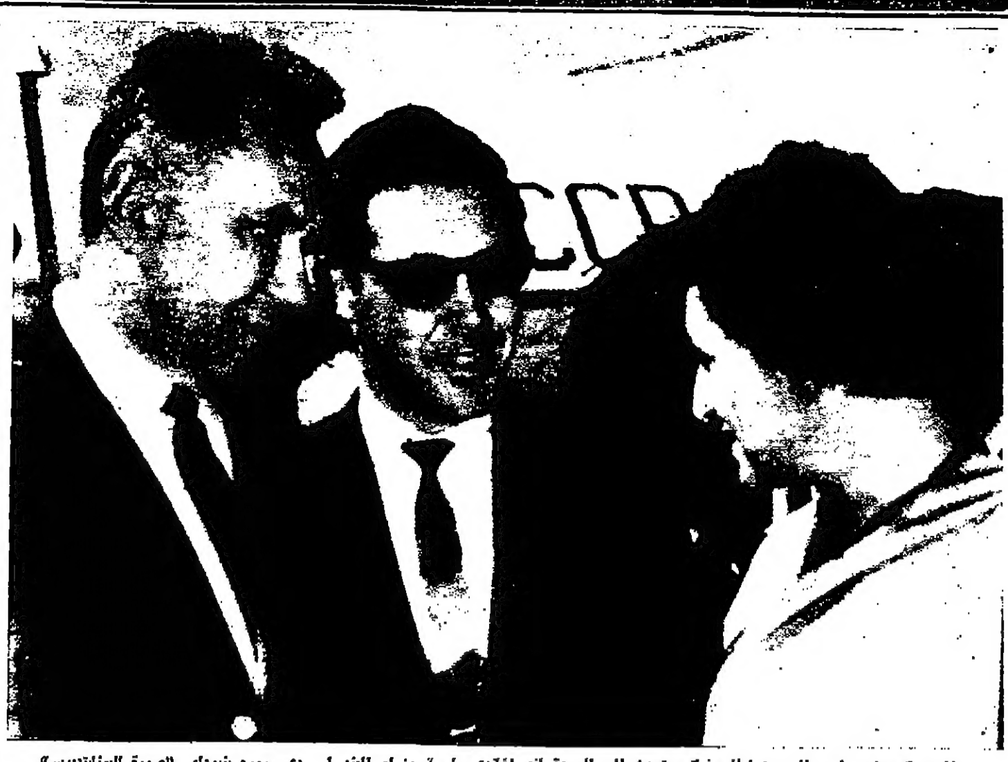
المستر كوسيفين رئيس الوزراء السويدي يتحدث الى السيدة اندراغندي رئيسة وزراء الهند كسدي مورو بنوديني (الصورة لليمين)

مقتل اسراييليين - بقية ما تزال تحتاج للتحقيق وتقصي الحقائق ؟ ان اصرار اسراييل على عدم السماح لممثل السيد ثالث بالتحقيق في اوضاع سكان المناطق المحتلة ، الا اذا قبلت الدول العربية بالسماح لهذا الممثل بالتحقيق فيما تزعمه اسراييل من تمييز عنصري ضد اليهود في ابلاد العربية ، هذا الاصرار يحد ذاته سخريه من الامم المتحدة ومن السيد ثالث . فاليهود في ابلاد العربية ( مواطنون ) عرب لا يحق لا اسراييل ولا لغير اسراييل التدخل في شؤونهم . بينما المواطنون العرب في المناطق المحتلة هم المعنيون بقرارات مجلس الامن والجمعية العامة ، وهم الذين يشكلون ( القضية ) التي تتسلل اذهان شعوب العالم اليوم . ان خطوة السيد ثالث في ارسال مندوبه للتحقيق في الظروف التي يعيش في ظلها المواطنون العرب في المناطق المحتلة ، خطوة ايجابية وان جاءت متأخرة - بقي ان نل بلن الحقائق التي سيكتشفها السيد ثالث سيعينها للعالم ، ان لم يكن لفضح اسراييل ، غلناص الحقيقه والتاريخ على الاقل .